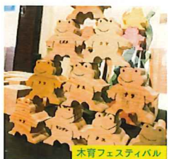
木育フェスティバル