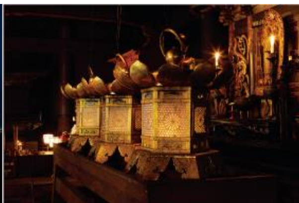
▲比叡山延暦寺の根本中堂（国宝）