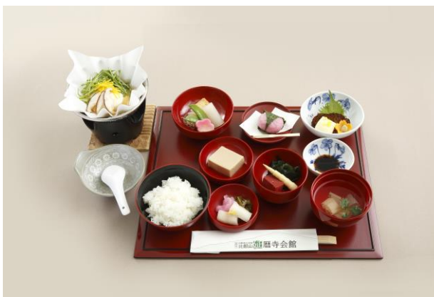
▲延暦寺会館でのお食事 「精進懐石膳」