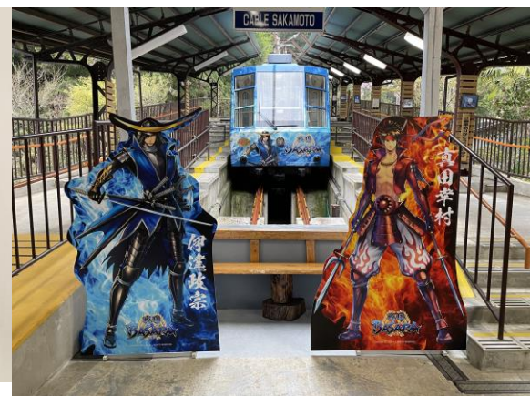
▲坂本ケーブル（BASARA ラッピング）